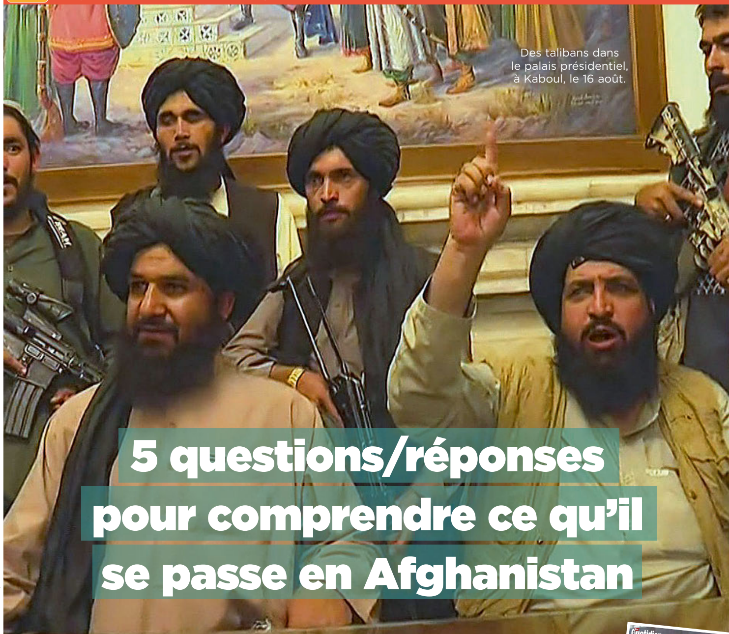
Des talibans dans le palais présidentiel, à Kaboul, le 16 août.

Pour les 10-13 ans : 10 minutes de lecture chaque jour