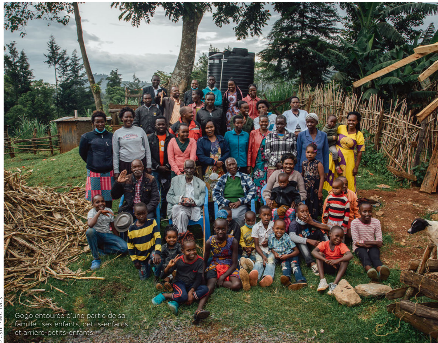
Gogo entourée d'une partie de sa famille : ses enfants, petits-enfants et arrière-petits-enfants.