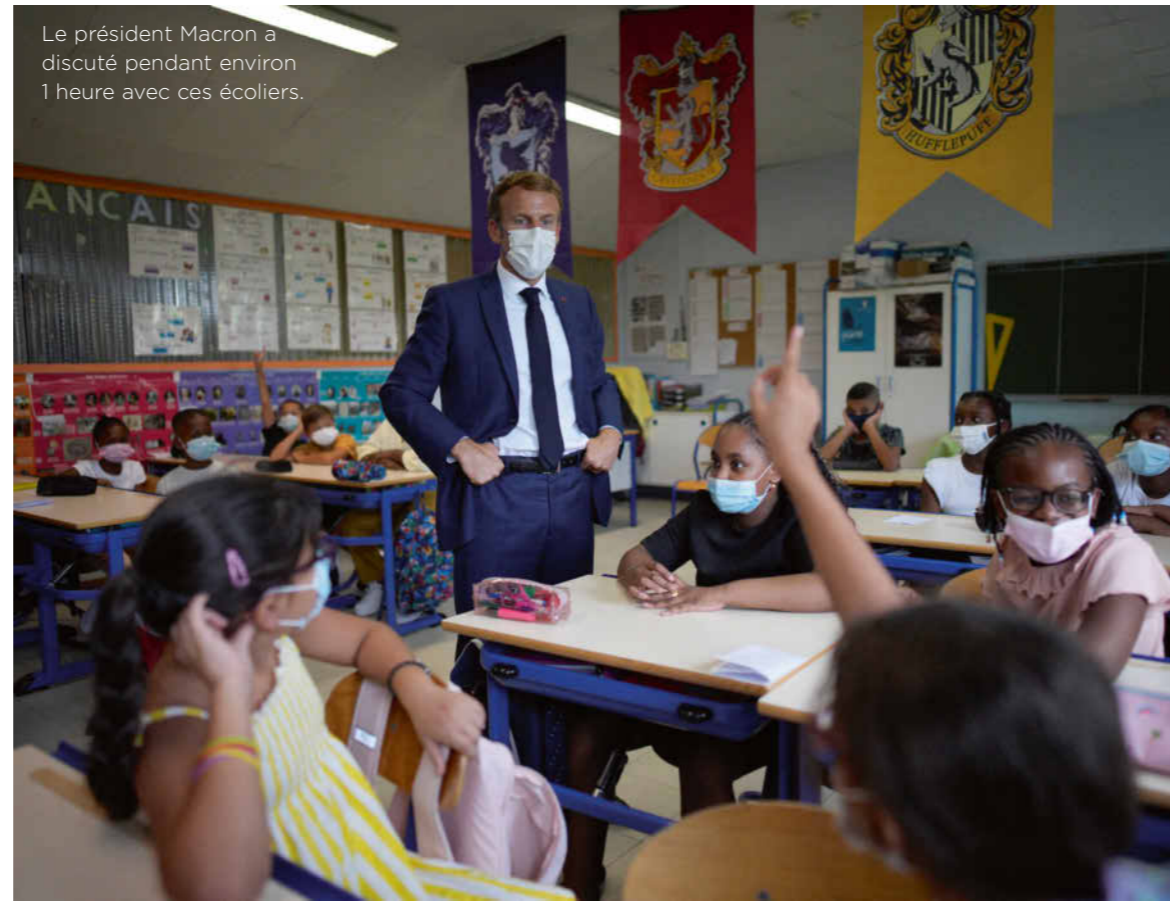
Le président Macron a discuté pendant environ 1 heure avec ces écoliers.