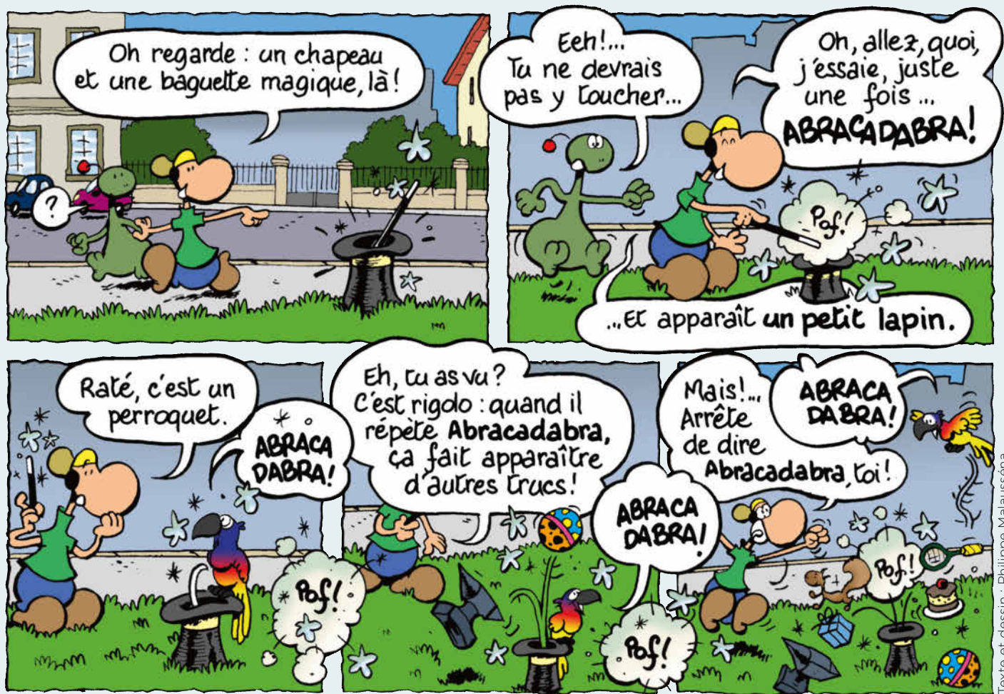
Suite dans le numéro du lundi