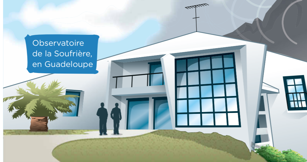
Observatoire de la Soufrière, en Guadeloupe

• La raison : cette année, les nombreuses éruptions de l'Etna ont provoqué une accumulation de roches et de lave solidifiée au sommet de l'un de ses cratères .