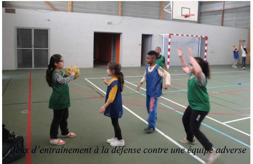
Jeux d'entraînement à la défense contre une équipe adverse

est animateur sportif. C'est la première année que nous pratiquons ce sport. C'est un sport collectif. Quand on arrive, nous séparons la classe en 4 équipes : les rouges, les bleus, les verts et les sans maillot. A travers différents jeux nous avons appris les règles du handball. Par exem-