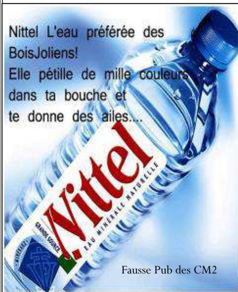
Fausse Pub des CM2