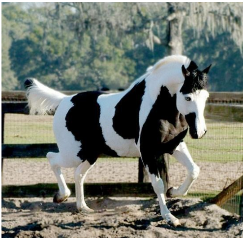
Lilou et Rosie, 6 e / 1

Ne jugez pas les gens à leur juste valeur Parce que vous en ignorez tout l'intérieur.