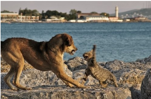
Emrys Rayan-Amir 6 e 3

Même les pires ennemis peuvent devenir meilleurs amis, Ce récit en est la preuve elle-même.