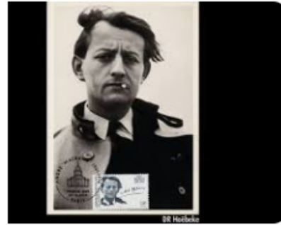
20 e anniversaire de la mort d'André Malraux.