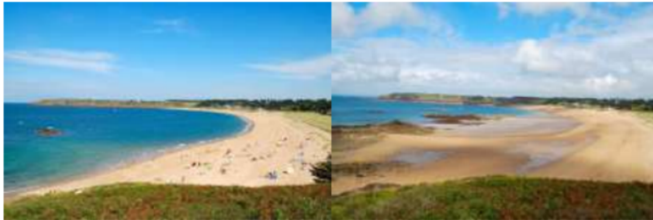
Une plage à marée haute.