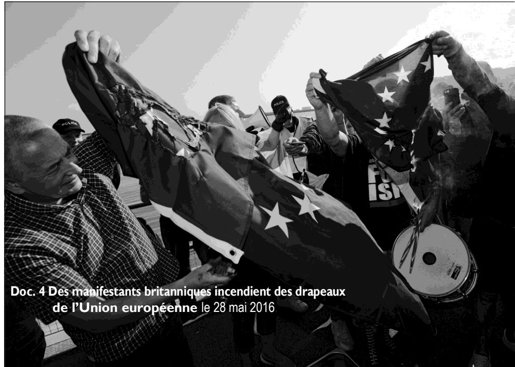
Doc. 4 Des manifestants britanniques incendient des drapeaux de l'Union européenne le 28 mai 2016

5. Quel est le principal reproche fait à l'Union européenne dans le texte 3 ?