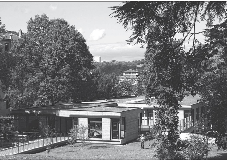
Doc. 1 Le centre de loisirs Caluire Juniors à Caluire-et-Cuire.

Je découvre comment un bâtiment MUNICIPAL peut s'intégrer à la nature.