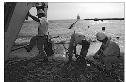
Doc. 4 Pose d'un réseau de câbles sous-marins reliant la France à Singapour et l'Algérie.

6. Quelles infrastructures sont nécessaires pour que le réseau Internet mondial fonctionne ?