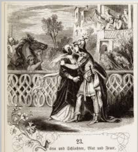
Illustration de « Le Cid » poème de Guillen de Castro (1569-1631)