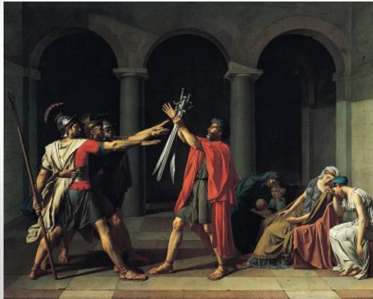
Le Serment des Horaces, Jacques-Louis David (1784-85)