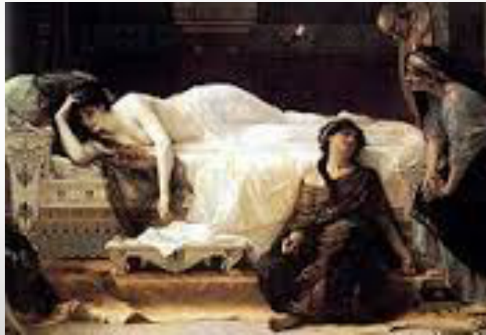
Alexandre CABANEL, Phèdre 1880