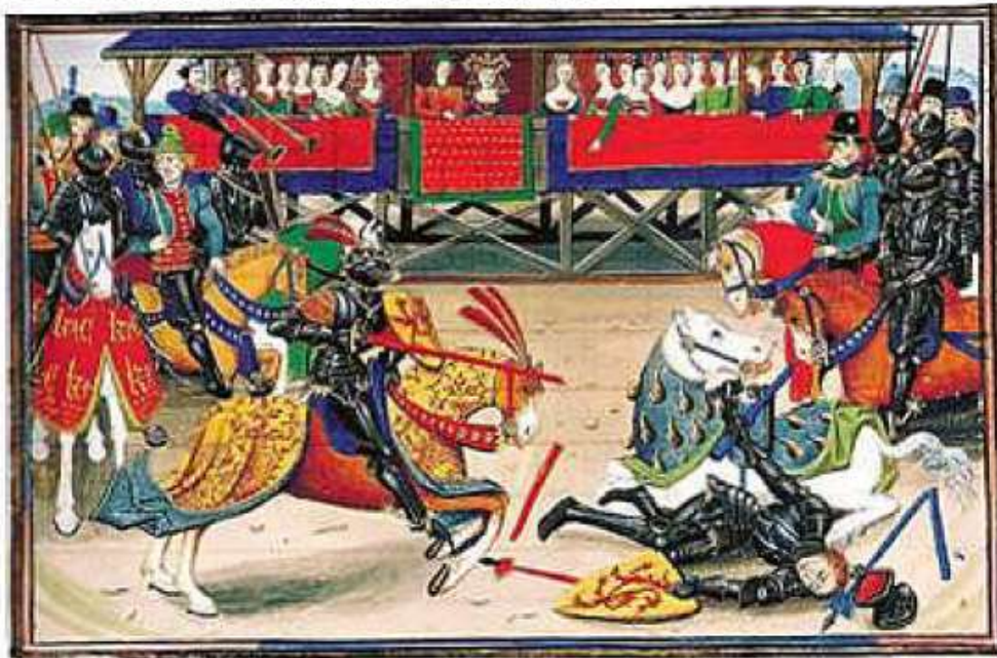
Enluminure du XIVème siècle