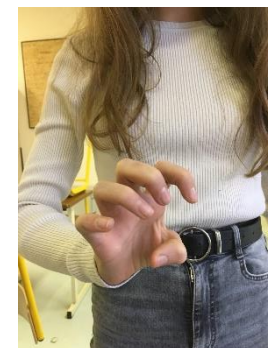
Iram impotentem prodo – je montre ma colère