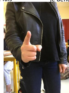
Terrorum incutio – je suscite la terreur