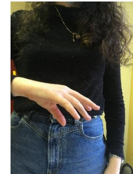
Dimitto- Je renvoie