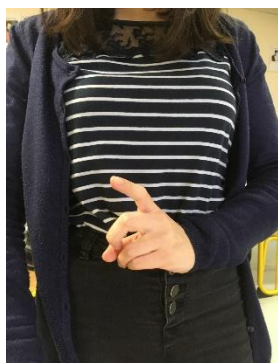
Veto – j'interdis