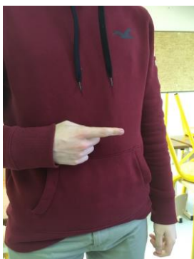
Indico – j'indique