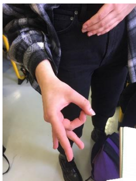
Ironiam infligo – je fais un trait d'ironie