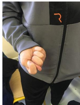
Improbis obicio – je fais un affront