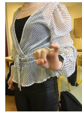
Contemptuose provooco – je défie avec mépris