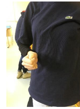
Avaritiam prodo – j'affiche mon désir fort