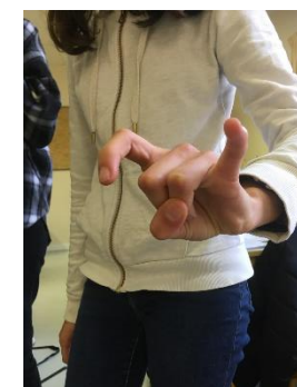
Stultitiae notam infigo – je fais le signe de la sottise