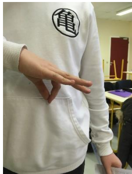
Parce do – Je donne peu

Mise en images par les élèves de 3 ème – Latin – 2020 - Comment les Anciens parlaient avec les mains