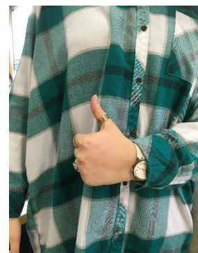
Approbo – j'approuve