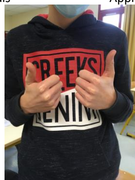
Extollo – je porte aux nues, j'honore