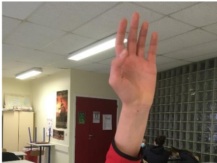
T - Suffragor Je vote pour