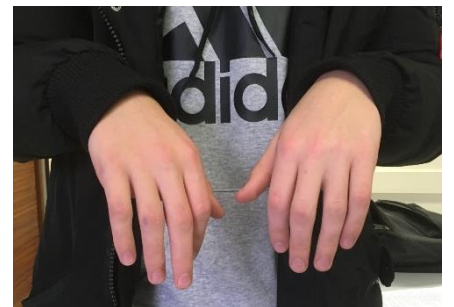
H – Despero Je perds espoir