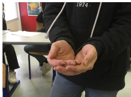
Z - Mendico Je mendie

Planche 1 de la Chironomia de John Bulwer, ouvrage paru en Pologne en 1644, illustrant les gestes supposés des orateurs antiques Classes de 3 ème Latin - 2020