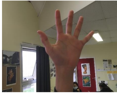
P – Triumpho Je triomphe