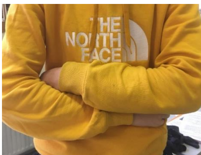
I – Otio indulgeo Je me repose