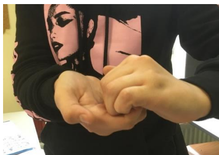
L – Innocentia ostendo Je montre ma vertu, mon innocence