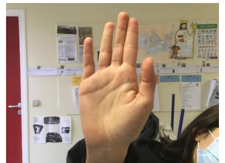
R – Juro Je jure