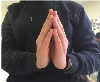
B – Oro J'implore