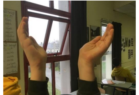
D - Admiror Je m'émerveille