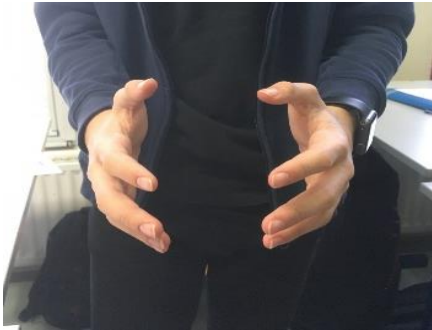
A – Supplico Je supplie

Comment les Anciens parlaient avec les mains