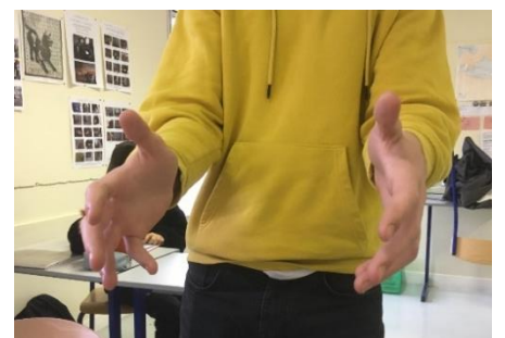
N – Libertatem resigno Je laisse la liberté