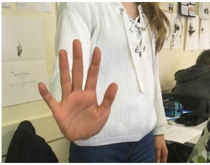
O – Protego Je garantis