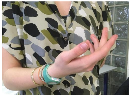
W - Invito J'invite, j'engage à