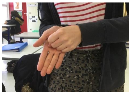
G - Explodo Je désapprouve, condamne