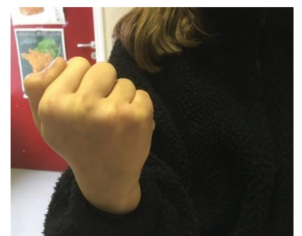
Y - Minor Je menace