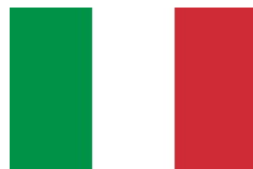
Le drapeau italien