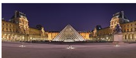
Musée du Louvre