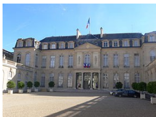
Palais de l'Élysée, demeure du président de la République

La République française est dirigée par le président de la République, élu par les citoyens français. Son mandat dure cinq ans. C'est lui qui nomme le Premier ministre qui dirige le gouvernement.