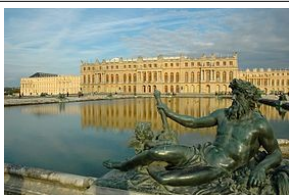
le château de Versailles

La France est le pays le plus visité au monde : ses paysages (avec des régions montagneuses, des stations balnéaires ou des volcans éteints) sont très variés. Son patrimoine historique, architectural et artistique est exceptionnel. Elle possède de nombreux lieux parmi les plus visités au monde : la Tour Eiffel, le Musée du Louvre, le château de Versailles.