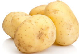
POMMES DE TERRE