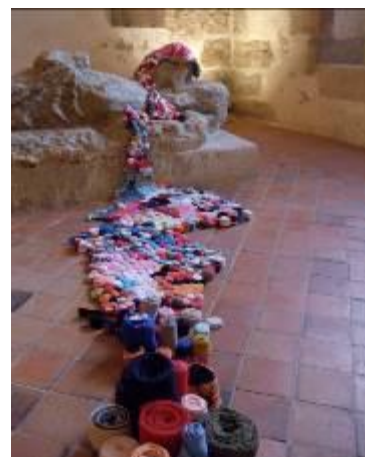
Sans titre Marie-Noëlle Deverre, XXIème siècle