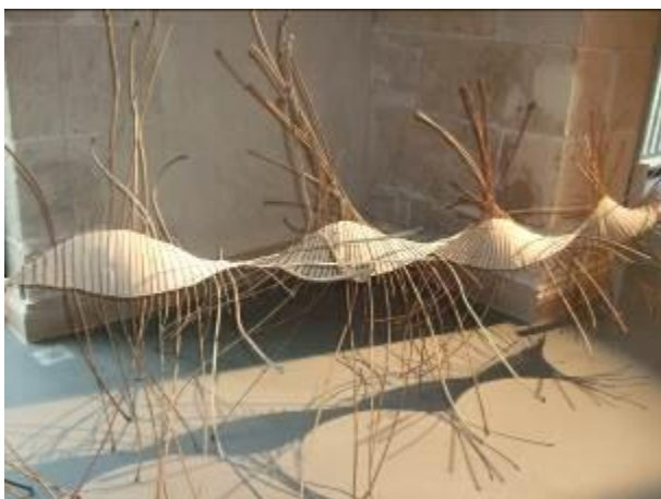
Sans titre (tissage lin et végétaux) Marie-Noëlle Fontan, XXIème siècle