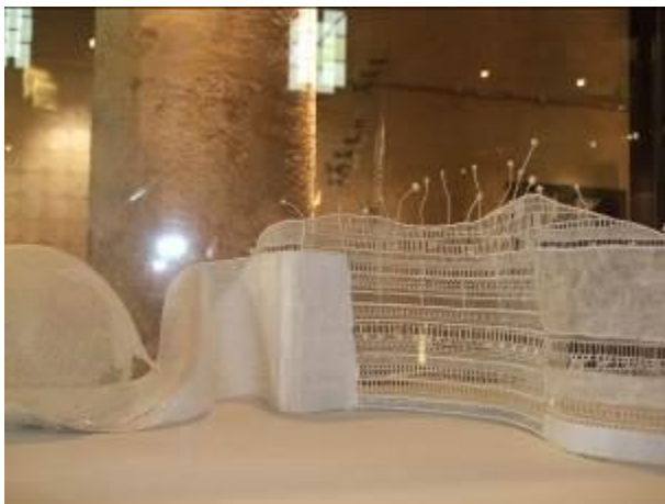
Chrysalide (détail) F.Wintz, XXème siècle

Ailleurs, les arts textiles peuvent être précieux : route de la soie, délicat tapis d'Orient, quilting et Patchwork savants d'Amérique du Nord, extraordinaires broderies d'Asie ou d'Europe de l'Est et enfin dentelle de Bruges, d'Alençon, de Calais.