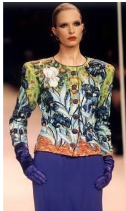
veste Iris Yves saint Laurent, 1988