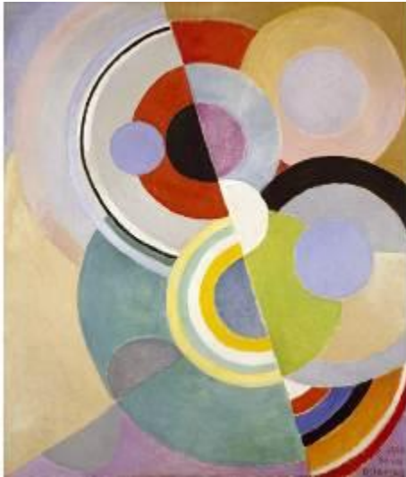
Rythmes colorées Sonia Delaunay - XIXème siècle