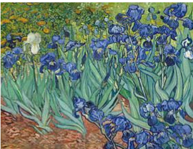
Iris Van Gogh, 1889