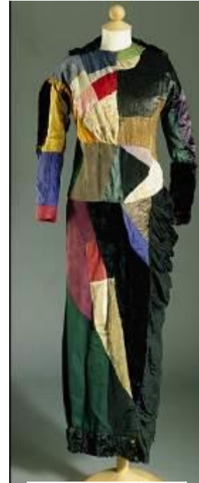
Robes simultanées Sonia Delaunay, 1920