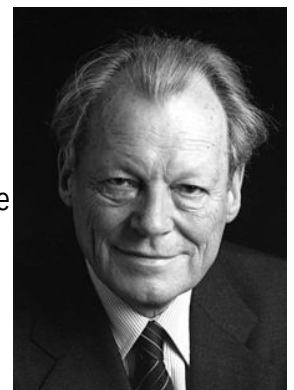
Willy Brandt en 1980

D'après la déclaration du chancelier de la RFA Willy Brandt le 28 octobre 1969.